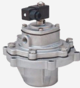
Válvula para Superficies Planas