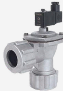
Válvula Conexión Rápida