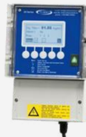
Unidad de Control para Sonda Triboeléctrica